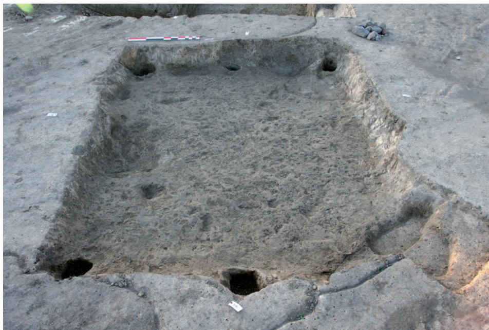
Fig. 5. (a) Dégagement du comblement d'une cabane semi-enterrée à la mini-pelle. Les déblais sont systématiquement triés à la main. © M. Châtelet, Inrap. (b) La cabane vidée de son comblement. © M. Châtelet, Inrap.