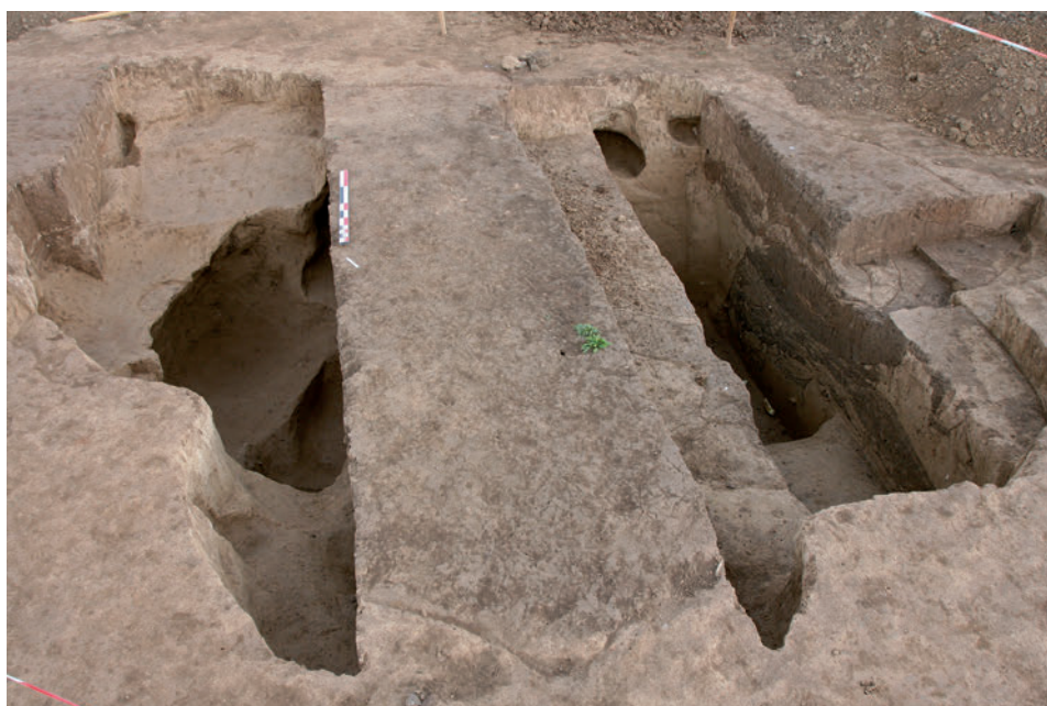
Fig. 6. Grande fosse d'extraction du limon, fouillée en associant les approches manuelle et mécanique. Son interprétation n'a pu être réellement établie qu'après avoir dégagé à la main l'un des côtés en mettant en évidence ses multiples creusements et les marches destinées à faciliter l'accès aux niveaux inférieurs.

Son recours sur un chantier ne peut être pour autant systématique et son utilisation doit être modulée en fonction des conditions particulières à chaque site, de ses problématiques scientifiques et du temps imparti à l'opération. À Marlenheim, la mini-pelle a été largement utilisée puisqu'elle a été présente pendant près de la moitié de l'opération. Intervenue dans une seconde approche du site, après une première phase de reconnaissance manuelle, elle a rarement été employée en continu. Dans la plupart des cas, son intervention a été associée à des contrôles et des finitions réalisés à la main, occasionnant des interruptions fréquentes de l'engin, mais nécessaires à la bonne compréhension des structures. Cette approche supposait une grande réactivité des fouilleurs et une équipe parfaitement informée des problématiques attachées au site et aux structures. Loin d'être systématique, le recours à la mini-pelle peut être ainsi assujéti à la réflexion scientifique et devenir un outil parfaitement adapté à nos besoins.